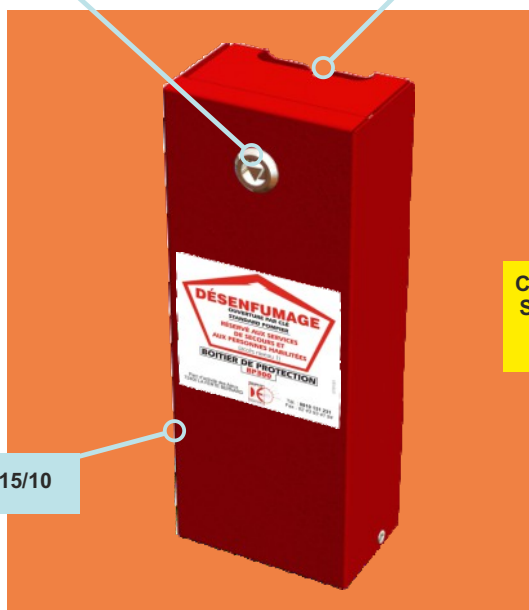
Tôle acier 15/10