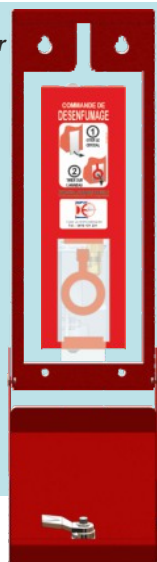
Exemple d'un boîtier installé sur un coffret CO 2

Ce boîtier s'installe SANS démonter le dispositif de commande